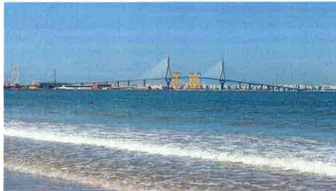
Puente de Cádiz visto desde El Puerto de Santa María.

Seopan y Tecniberia presentan una propuesta de inversiones por valor de 100.428 millones de euros para la recuperación y modernización del país.